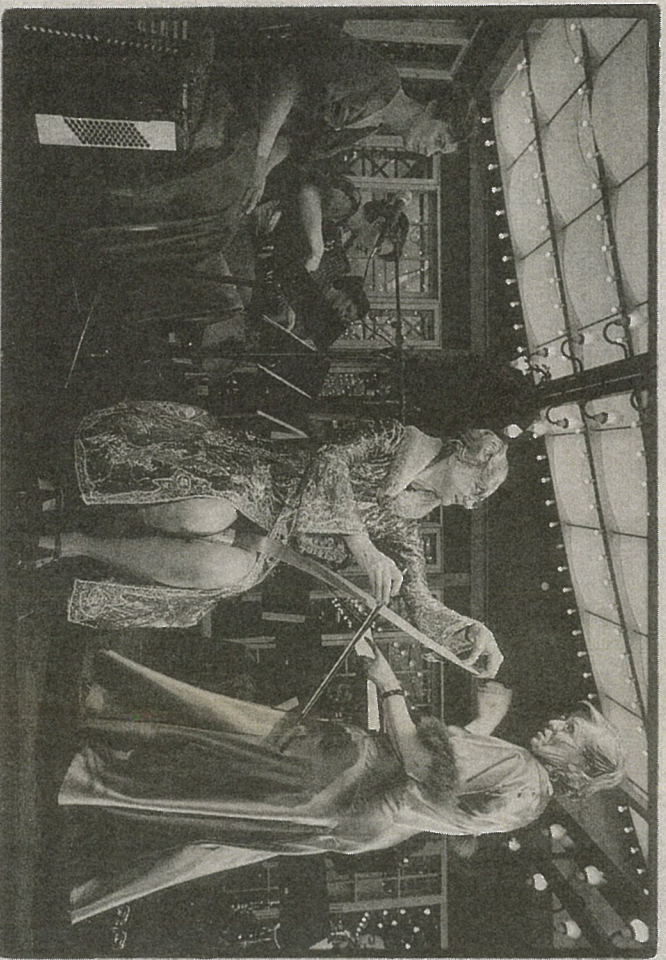
Der er ægte 30'er-stemning, når 14 Red Ladies spiller op.